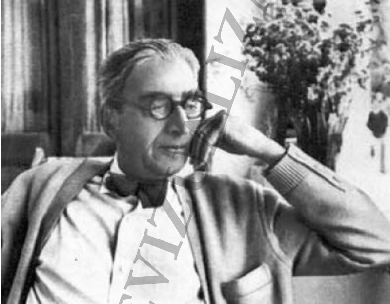
MIHAIL JORA 1881 – 1971