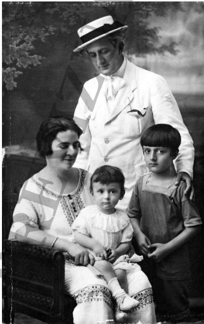
Familia Lipatti, 1924.

P. S. Vă cer mii de scuze pentru scrisul la mașină; este poate cel mai bun mijloc de a scrie frumos !!