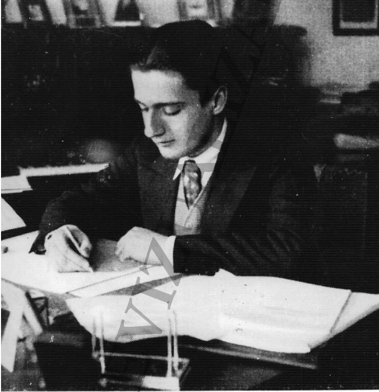
DINU LIPATTI 1917 – 1950